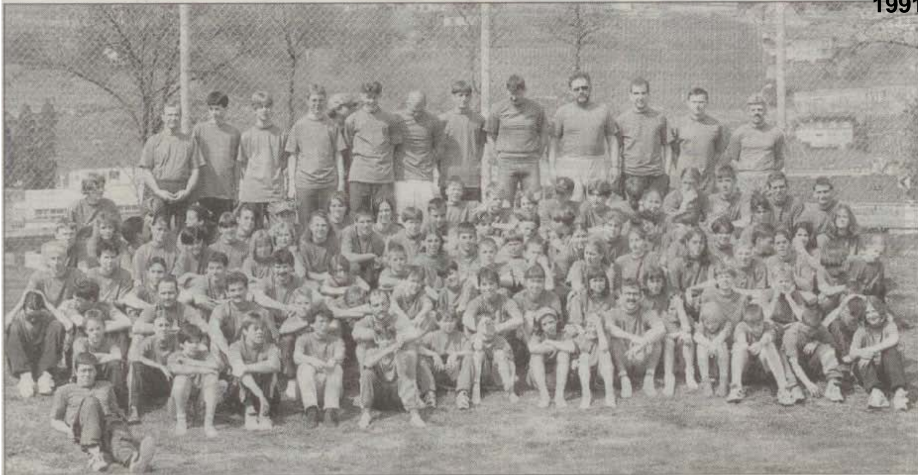
110 sportbegeisterte Jugendliche und ihre Leiter sowie eine gut eingespielte Küchenequipe verbrachten eine herrliche Woche in der Sonnenstube der Schweiz.